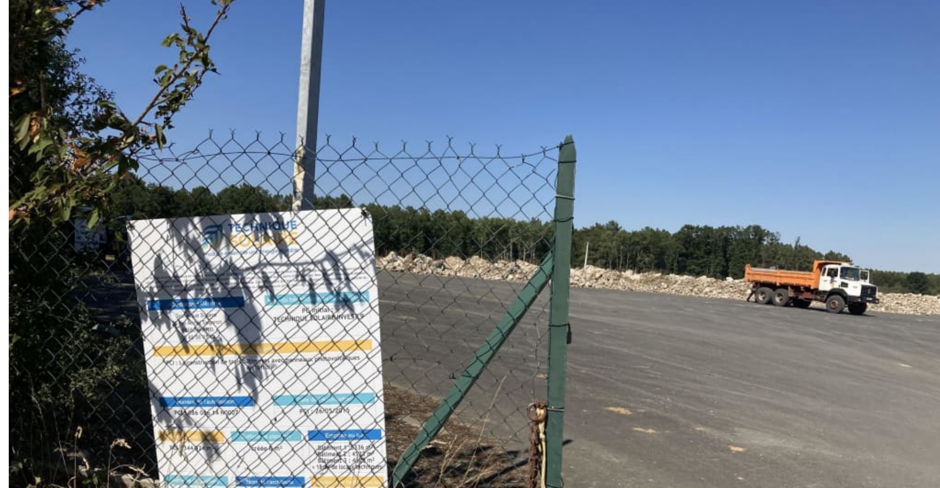
Sur le site de Coussay-les-Bois, un camion déchargeait des pierres et des gravats ce mercredi après-midi 10 août 2022.